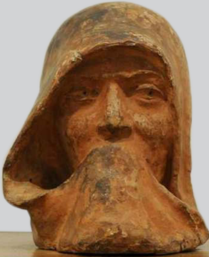
Refugee Women (S.L. Prashar) Partition Museum